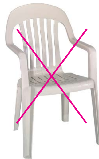
Exempel på möbel som vanligtvis inte godkänns på uteserveringar på offentlig plats i Täby.

Förutom ovanstående krav så vill kommunen i sitt arbete mot ett friskare Täby att uteserveringar är rökfria i så stor utsträckning som möjligt. Kommunen förordar därför att minst hälften av sittplatserna på uteserveringar med fler än tio sittplatser ska vara helt rökfria.