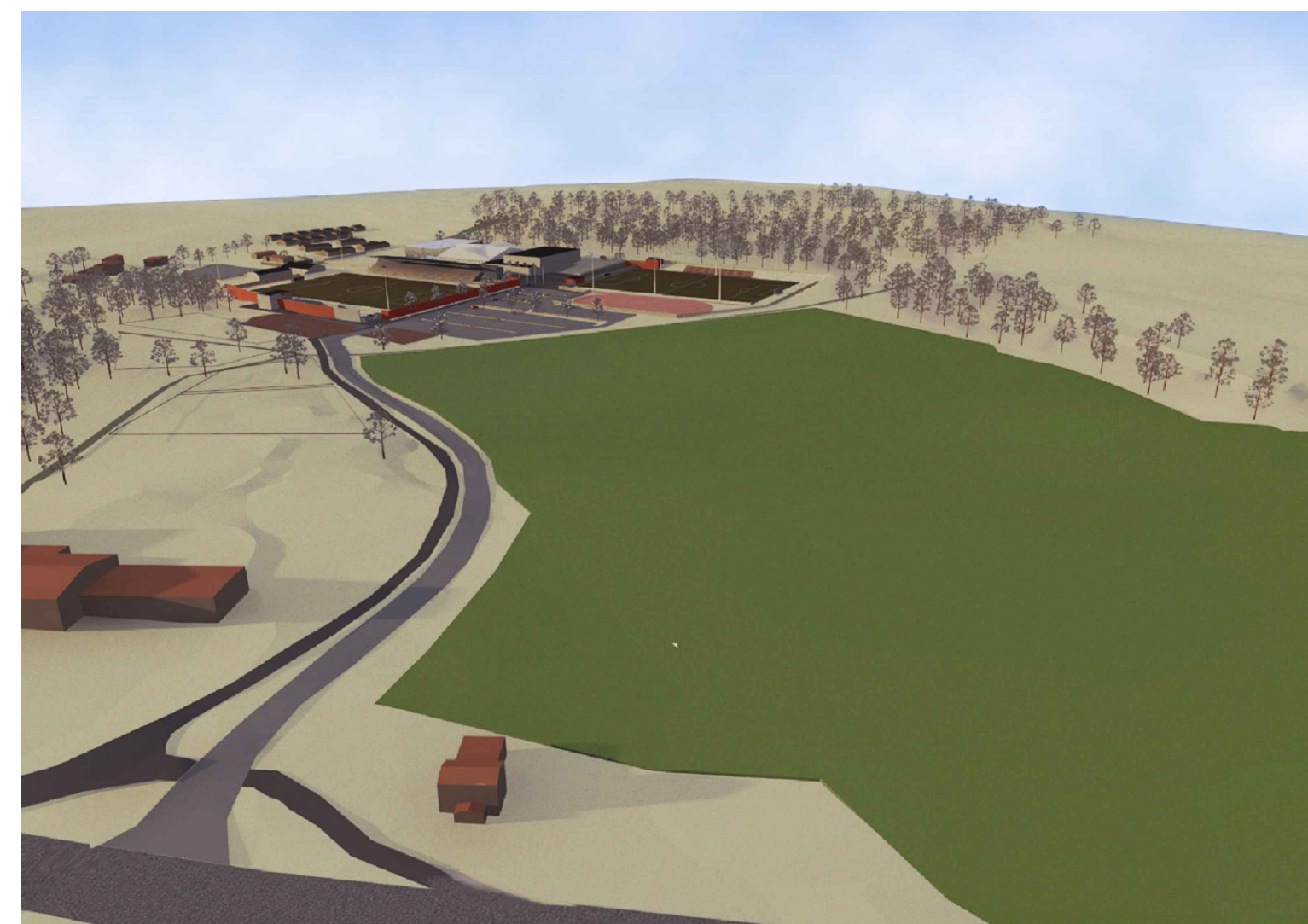
Vy över planområdet från Prästgårdsvägen