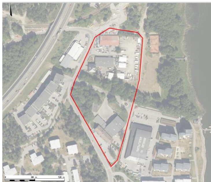
Detaljplanens ungefärliga omfattning

Området är beläget vid Sjöflygvägen och Pontongränd i södra Hägernäs och omfattar fastigheterna Fenan 1, Flygkompassen 1, Höjdmätaren 1, Stjärnmotorn 1 och 2 som tillsammans har en yta på ca 20 000 kvm. Delar av Hägernäs 7:5 och 7:6 kan komma att ingå i detaljplanen. Inom de privatägda fastigheterna finns idag kontor, småindustri och verksamheter i form av bl. a. båtuppställning och restaurang. Den kommunägda marken utgörs av gator och parkmark där Rönningebäcken rinner genom området på sin väg till Stora Värtan.