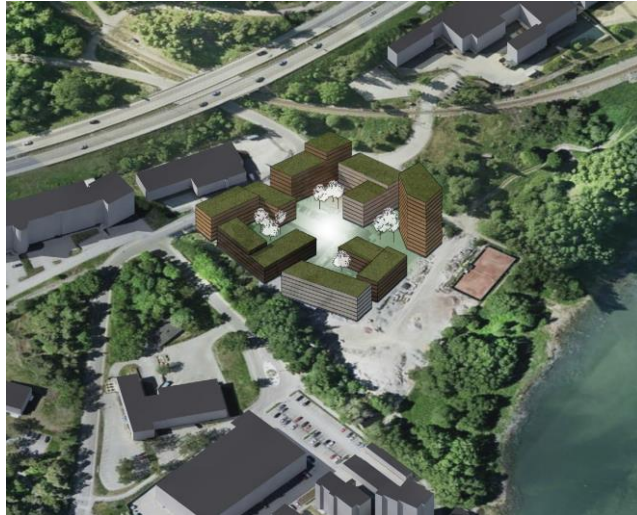
Skiss över alternativ A för Flygkompassen 1 m. fl.

Alternativ B föreslår placera byggnaderna i en kvartersliknande men lite mer uppbruten struktur som följer områdets befintliga byggnadstypologier. Även detta alternativ är uppdelad i två etapper. Etapp 1 som förhåller sig inom fastighetsgräns och innehåller ca 250 bostäder och Etapp 2 som är ritad på kommunens mark och innehåller ca 120 bostäder. Byggnaderna föreslås uppföras inom kvartersliknande struktur med varierande höjder från 4 till 7 våningar samt tre stycken punkthus som är 8, 10 och 12 våningar.